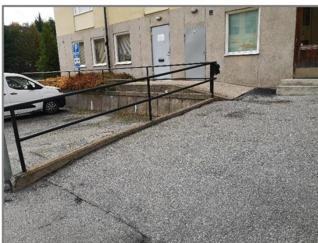
Entré med ramp.