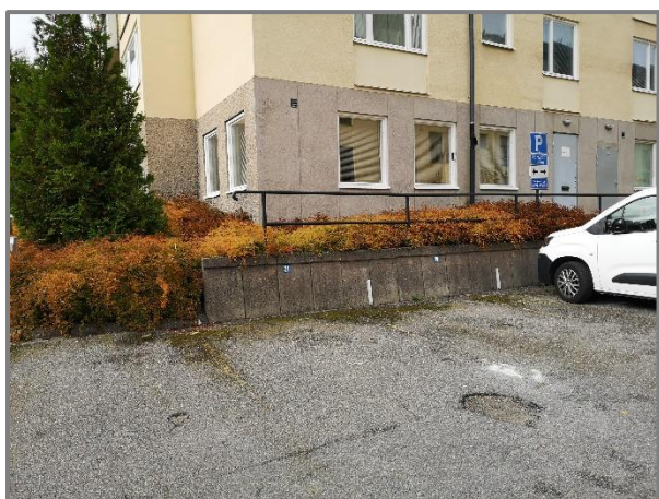
Stora fönster ut mot gatan.

Centralt i Södertälje. Promenadavstånd till pendeltåg och Södertälje Centrum. Lugnt läge i botten på ett bostadshus. Lämpligt för lugn verksamhet då det är bostäder ovanpå lokalen