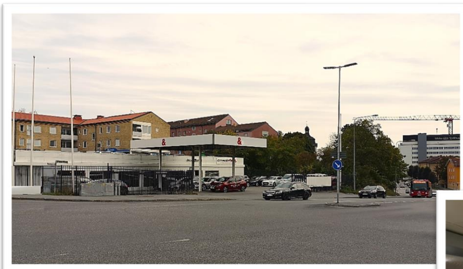
Bra läge vid Birkakorset nära sjukhuset

Lokalen är lämplig som butik, möbelutställning, garage, förråd mm. Takhöjden är 2,5m. Skyltläge vid Södertäljes mest trafikerade korsning. Inhägnad kundparkering.