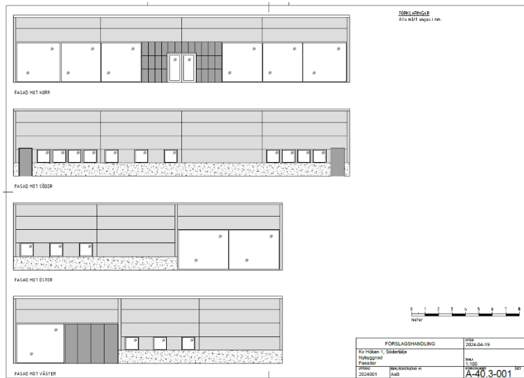
Exempel på utförande.