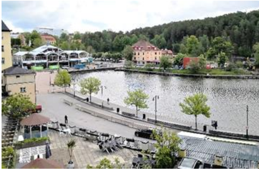
Utsikt mot Maren