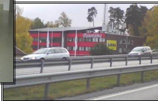
Skyltläge mot motorvägen.