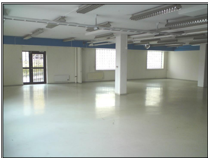
Flexibla öppna ytor. Utställning, butik, lager

Bra läge för industributik eller lager. 320 kvm ytor med inlastning via låg lastkaj på baksidan. Öppna ytor som kan anpassas till olika verksamheter. Huset har skyltläge mot E4/E20.